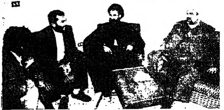
حارة صيدا - من زينة نقوزي

دعا المفتي الجعفري الممتاز الشيخ عبد قبلان الحكومة الى وضع دبلوما سيئتها بحالة استنفار شامل بالنسبة لوضع الجنوب، وقال لا يجوز لنا ان نبقى منهمكين في العمل الصغير لحل المشكلات الصغيرة او الاختراقات التي تقع في صفوف اهلنا من مناطقنا الوطنية، بل علينا ايضا ان نقل الصراع على خطوط التماس لان وراء تدمير هذه الخطوط العدو الاسرائيلي.